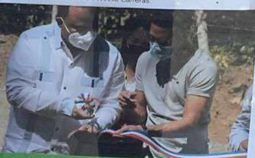
Alcalde y el Concejo de Regidores dejaron inaugurado puente en la comunidad de Compadre Pascual.