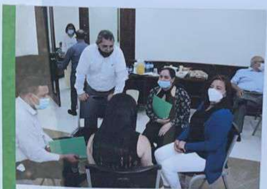
Funcionarios de la Alcaldía reciben talleres de capacitación para eficientizar el servicio.

MATERIA: INMOBILIARIA, CITACION PARA AUDIENCIA DE SANEAMIENTO, DEL TRIBUNAL DE TIERRAS DE JURISDICCION ORIGINAL, SALA 1. EXP. NÚMERO 0998-20-00454, POS. NO. 312175521127, con una Porción 45.91 m2, Solar 6 y 7 Manzana 6, Del Distrito Catastral No. 01, del Municipio de Jarabacoa, Provincia La Vega.