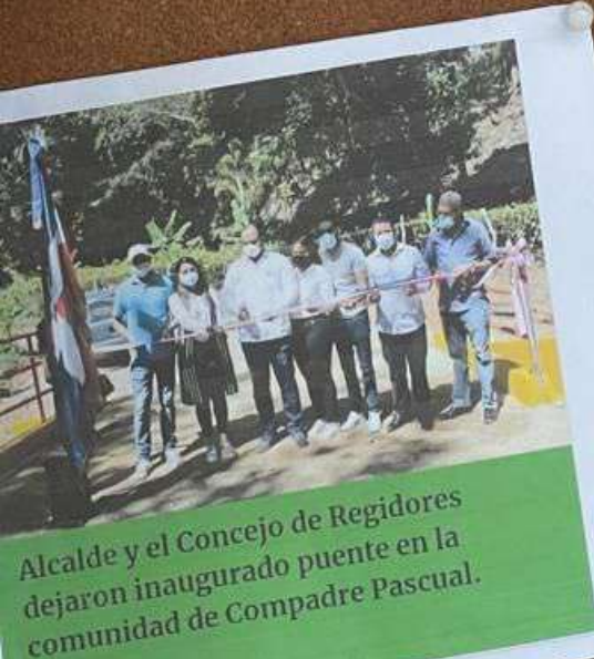
Alcalde y el Concejo de Regidores dejaron inaugurado puente en la comunidad de Compadre Pascual.