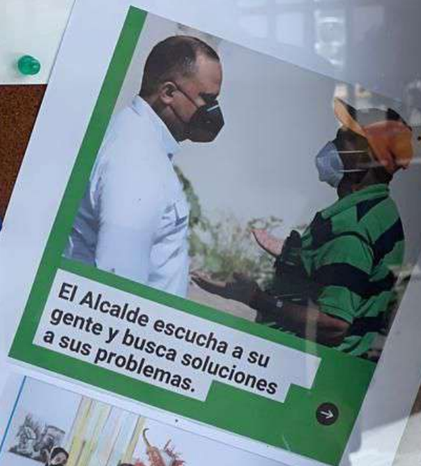
El Alcalde escucha a su gente y busca soluciones a sus problemas.